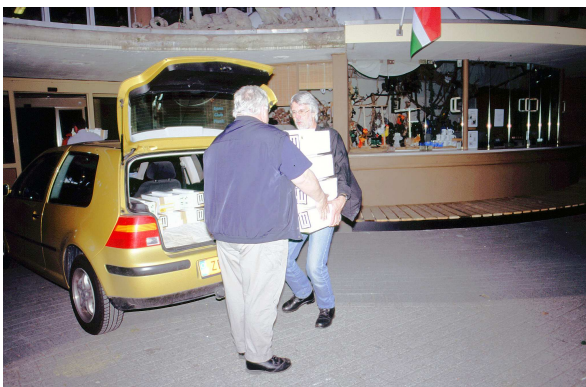
aankomst van de 'Hongkong II dieren' in Blijdorp

Net als bij de 'Hongkong I groep' duurde het erg lang eer de benodigde CITES-documenten voor import en export verleend werden. Dat is jammer, vooral omdat het ging om een reddingsoperatie waarbij het voor de overlevingskansen van groot belang was om snel te handelen. Door de late verlening kwamen de schildpadden pas op 9 juni 2004 (dus ruim drie maanden na aanmelding!!) op Schiphol aan. Alle deelnemers werden tijdig over de aankomst van hun dieren geïnformeerd en hen werd gevraagd om ze dezelfde avond of in een enkel geval de dag daaropvolgend bij Zwartepoorte op te halen. Diergaarde Blijdorp zegde de eerste opvang voor enkele deelnemende dierentuinen toe.